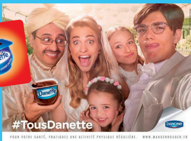
En haut : 2014, campagne #TousDanette Ci-dessous : campagne digitale 2017