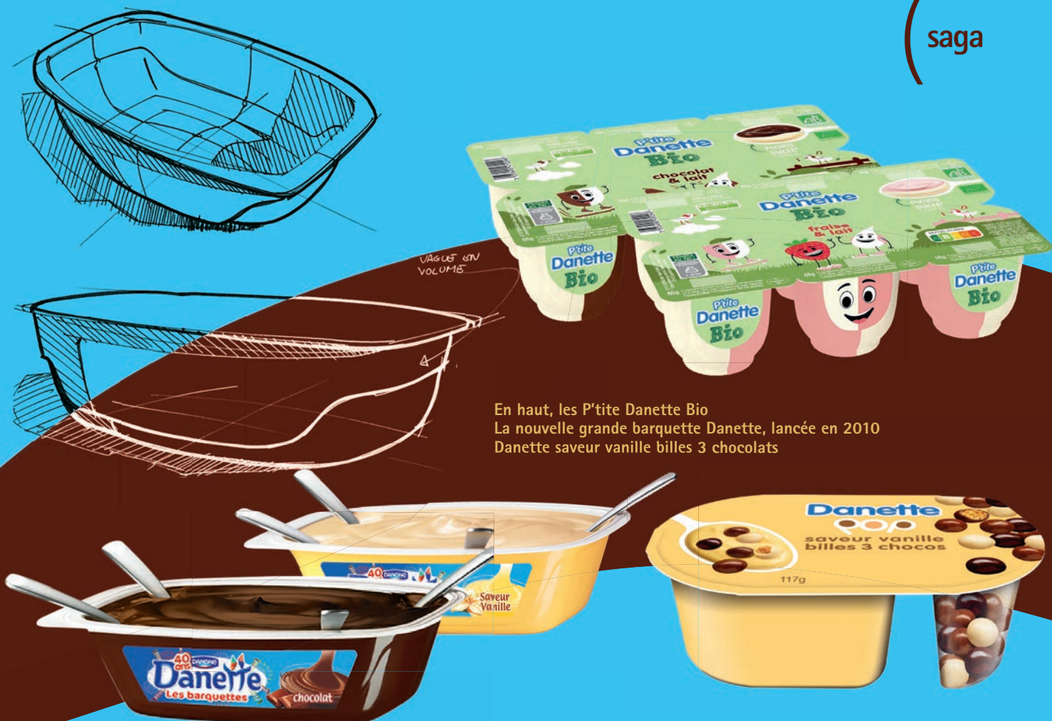
En haut, les P'tite Danette Bio La nouvelle grande barquette Danette, lancée en 2010 Danette saveur vanille billes 3 chocolats

ses 50 ans cette année, a étendu son territoire des crèmes desserts aux liégeois en 2013 et aux mousses 8 en octobre 2019. Danette est au nombre des 50 marques les plus fortes en France, tous secteurs confondus 9 et est la neuvième marque de PGC-FLS la plus consommée en France 10 . Elle aussi, reste debout, en évitant de s'asseoir sur ses lauriers !