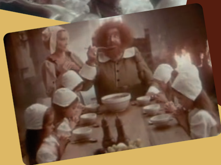
La barquette légendaire de Danette La cour du jeune roi, 1973 Publicité l'ogre, 1974