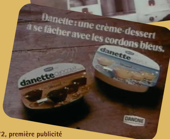
1972, première publicité télévisée de Danette