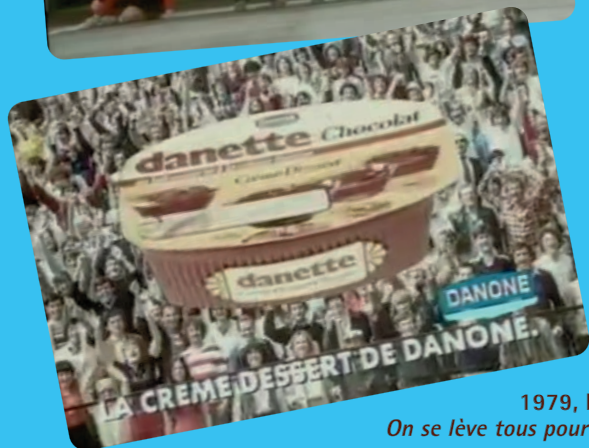
1979, le slogan On se lève tous pour Danette

Gotainer 18 . Dans son livre Disruption , Jean-Marie Dru, qui a travaillé pendant une quinzaine d'années pour Danette, se souvient que « pendant ses sept premières années, le produit fut installé à partir d'une stratégie classique promesse-support. Danette était meilleure, parce que c'était la "seule crème dessert avec de la crème fraîche dedans". Le résultat fut loin d'être négligeable : Danette obtint le leadership du marché avec 8 000 tonnes par an ». Le déclic se produisit quand, poursuit Jean-Marie Dru, à la fin des années 1970, « quelqu'un proposa alors une stratégie d'anticipation. Puisque Danette était le dessert préféré des Français, pourquoi ne pas passer à un discours de leader et jouer l'unanimité ? La campagne "Que tous ceux qui aiment la Danette se lèvent" fut lancée. La crème fraîche était tombée dans les oubliettes. Trois ans plus tard, Danette vendait plus de 40 000 tonnes par an. »