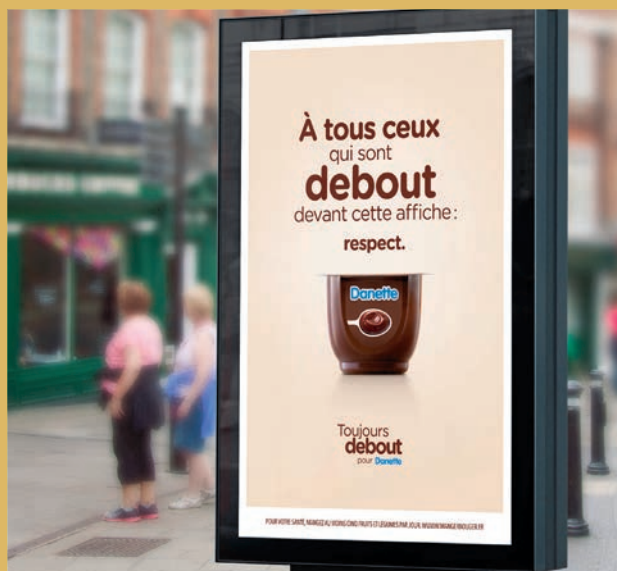
2019, dernière campagne publicitaire en date