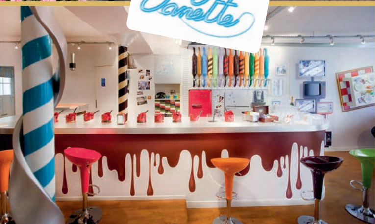
2010, campagne d'activation pour les 40 ans de la marque